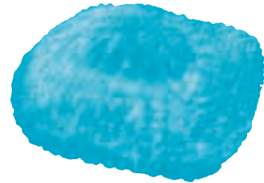
Virus de la pigota

Per a reproduir-se estan obligats a parasitar cèl·lules vives, però fora d'estes cèl·lules no mostren senyals de vida. Estes característiques fan que siga molt difícil combatre'ls, perquè els fàrmacs no poden diferenciar les cèl·lules sanes de les que estan infectades.