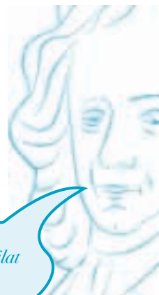
Antoine Laurent Lavoisier (1743-1794)

Si he vist més lluny és perquè m'he enfilat dalt de gegants.