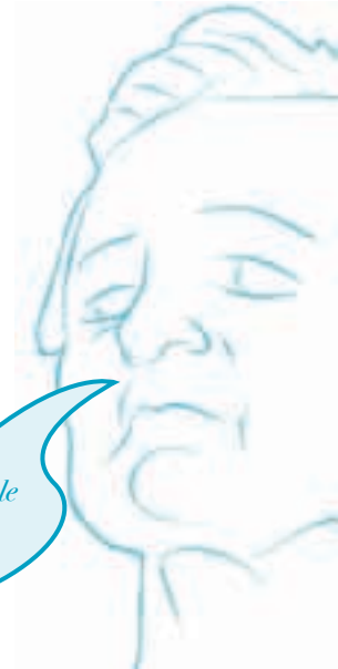
Edward Jenner, en 1806

Este viatge restarà com el més memorable en els annals de la història.